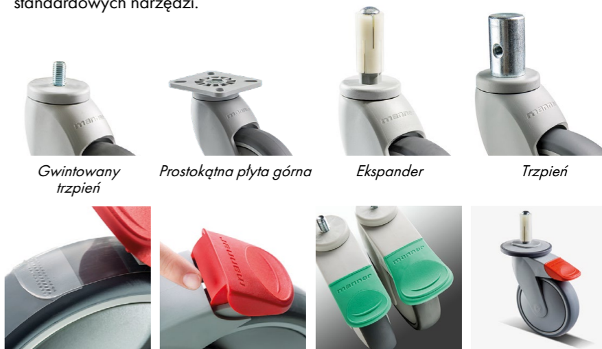
Gwintowany trzpień Prostokątna płyta górna Ekspander Trzpień Warstwa ochronna na bieżniku Unikatowa ochrona przed uszkodzeniem palców i brudem Duże i małe pedały hamulca Zderzak

Kółka Tango do urządzeń dostępne są w trzech rozmiarach: 75 mm, 100 mm i 125 mm. Materiał bieżnika i jego twardość mogą być dobrane spośród kilku opcji. Standardowe rozwiązania mocowania obejmują trzpień gwintowany, prostokątną płytkę górną oraz ekspander. Mocowania trzpienia dostępne są jako produkt specjalny. Budowa widelca umożliwia proste przymocowanie kółek przy pomocy standardowych narzędzi.