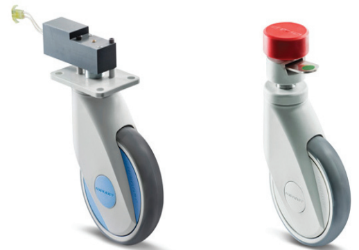
Manner e-Smart ja Manner Smart