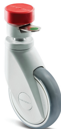
Lukollinen Manner® SMART

Kysykää lisää lähimmältä jälleenmyyjältänne tai suoraan tehtaalta!