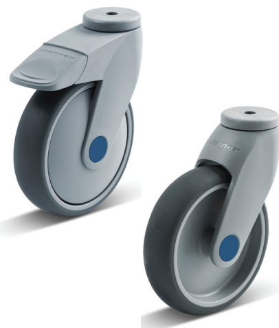
Ruostumaton, kuulalaakeroitu Tango G2 (vasemmalla) ja ruostumaton, liukulaakeroitu Tango G2

Suosittu Tango G2 -tuotesarjan pyörä saa nyt myös ruostumattomina. Sekä 100 että 125 millimetrin kuulalaakeroitu ja liukulaakeroitu Tango on saatavana ruostumattomina. Kuulalaakeroitussa on sekä haarukan kääntölaakerissa että pyörän laakerissa ruostumaton kuulalaakeri. Liukulaakeroitussa haarukan kääntölaakeri on ruostumaton kuulalaakeri ja liukulaakerina toimii messinkiholkki. Ruostumattomia Tangoja käytetään ennen kaikkea kohteissa, jotka vaativat säännöllistä pesua, kuten suihkutuolit ja suurkeittiökalusteet. Ruostumattoman version erottaa tavallisesta Tangosta sinisestä peitelevystä (kuvassa). Kysykää lisää lähimmältä jälleenmyyjältänne tai suoraan tehtaalta!