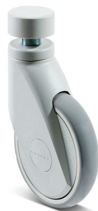
Lukoton Manner® SMART