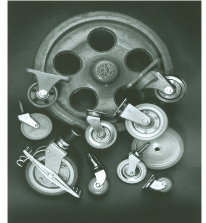
Mannerin pyörätuotteita 1940- ja 1950-luvulta