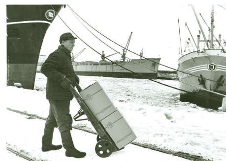
Hangon satamassa oli käytössä Mannerin valmistamia kärryjä.